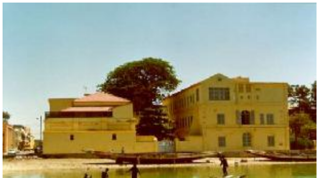
Lycée Cheikh Omar Foutiou Tall

Das Gymnasium Faidherbe von Saint-Louis war das erste Gymnasium, das 1884 durch Frankreich außerhalb seines eigenen Territoriums gegründet wurde. 1984 erfolgte die Umbenennung in „Lycée Cheikh Omar Foutiou Tall“. Cheikh Omar Foutiou Tall war einer der Anführer des islamischen Widerstands gegen die französische Kolonialmacht unter Faidherbe Ende des 19. Jahrhunderts.