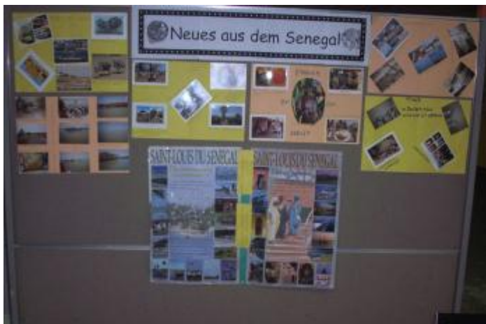
Senegal-Infobrett in der KGSE