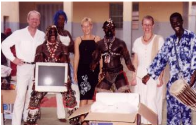
PC-Übergabe im LCOFT im Oktober 2001